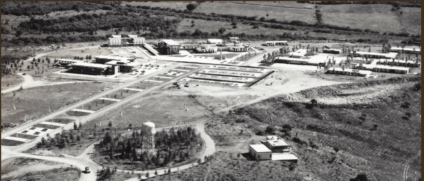
Centro Universitario en 1967

Nuevos descubrimientos documentales sobre los antecedentes de la Universidad Autónoma de Tamaulipas