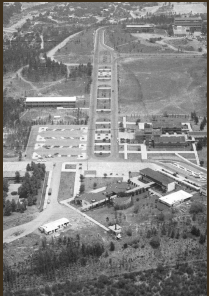
Vista aérea del centro universitario en 1967

tutiva de la Universidad de Tamaulipas. Asimismo, en la misma fecha se expidió la Ley Orgánica de la Universidad la cual en su artículo primero establecía que "La Universidad de Tamaulipas tendrá sus oficinas directivas en Ciudad Victoria, y las Facultades, Escuelas, Institutos y Departamentos, estarán en las ciudades del estado que se determine, de acuerdo con las necesidades de la población". Más adelante agregaba que no obstante que se encontraría dispersa, la Universidad será una institución uniforme y coherente, característica que conserva hasta nuestros días.